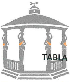
TABLA ESTADÍSTICA DE LA CUARTA SESIÓN DEL PRESENTE AÑO DE LA COMISIÓN EDILICIA DE TRÁNSITO Y VIALIDAD.